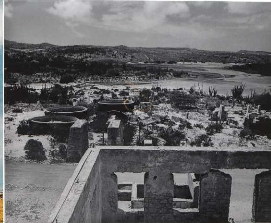
Fabrica di Oro na Balashi